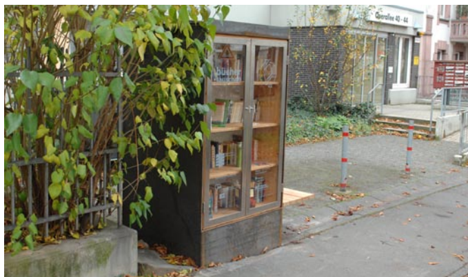
Büchertauschbörse von Kassel-West e.V. in der Querallee

Ziele des Vereins sind die Förderung und die Vernetzung von Aktivitäten im Stadtteil in den Bereichen Kunst, Kultur, Stadtteilentwicklung und Stadtteilgeschichte. Durch Stadtteilkonferenzen, Internetportal und Veröffentlichungen wird die Kommunikation im Stadtteil unterstützt.