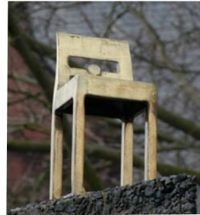
Der Stuhl des Chefredakteur Karl Marx